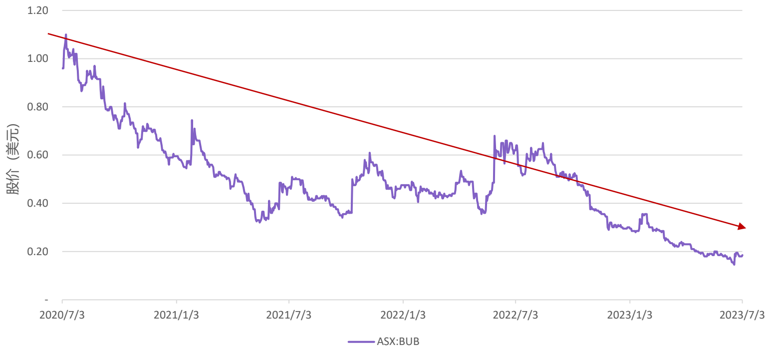
Bubs股价一览（2020年7月-2023年7月）